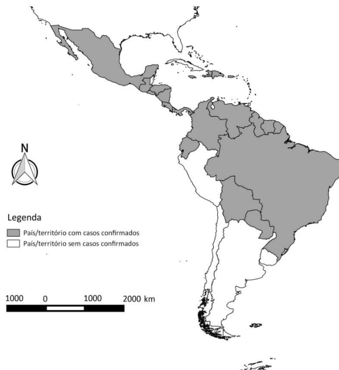
Figura 3 - Países e territórios com transmissão autóctone do vírus Zika nas Américas, até a SE 07/2016.

Até SE 07/2016, confirmou-se a transmissão autóctone do vírus Zika em 29 países/territórios nas Américas, como apresentado na Figura 3 .