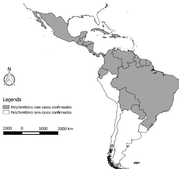
Figura 3 - Países e territórios com transmissão autóctone do vírus Zika nas Américas, até a SE 11/2016.

Até 17 de março de 2016, confirmou-se a transmissão autóctone do vírus Zika em 33 países/territórios nas Américas, como apresentado na Figura 3 .