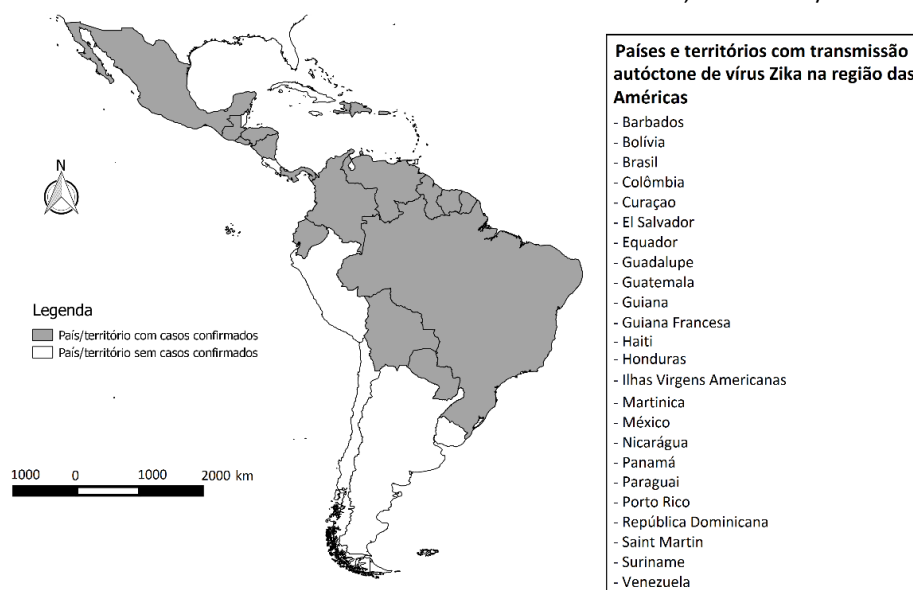
Figura 3 - Países e territórios com transmissão autóctone do vírus Zika nas Américas, até a SE 04/2016.