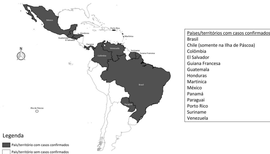
Figura 3 - Países e territórios com casos confirmados de transmissão autóctone do vírus Zika nas Américas, até a semana epidemiológica 01/2016.

Dados atualizados na semana epidemiológica 01/2016 (03 a 09/01/2016).